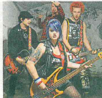
Heute: Rather Raccoon