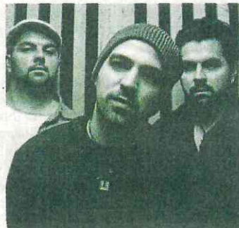
21. April: Squadra Leone