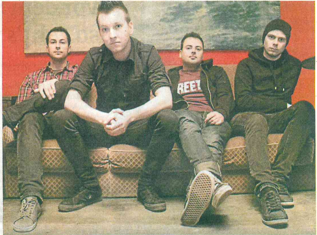
Radio Havanna aus Berlin spielen am heutigen Freitag, 13. April, im Jugendzentrum Gleis 1 in Abensberg.

Neu ist auch das Programm „Brot und Spiele“ (7. Mai, 16 Uhr), bei dem die JUZler gemeinsam kochen und in